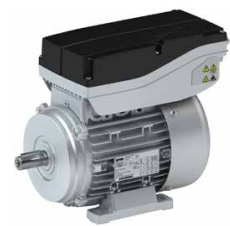
Lenze Smart Motor