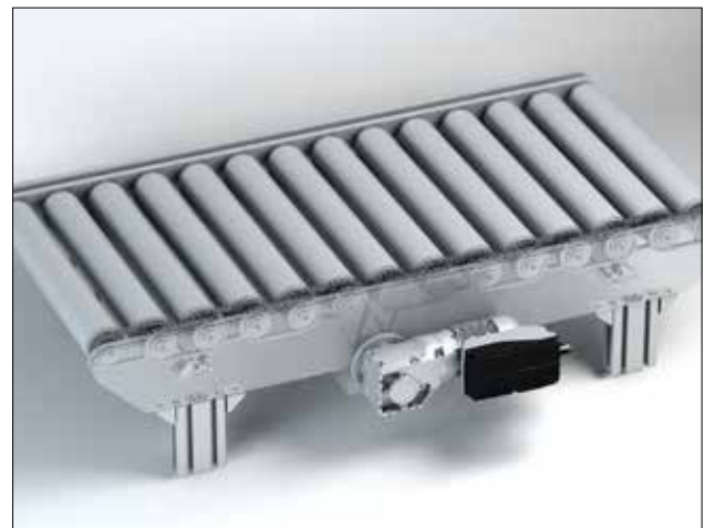
Beispiel: Roller Conveyor Outline