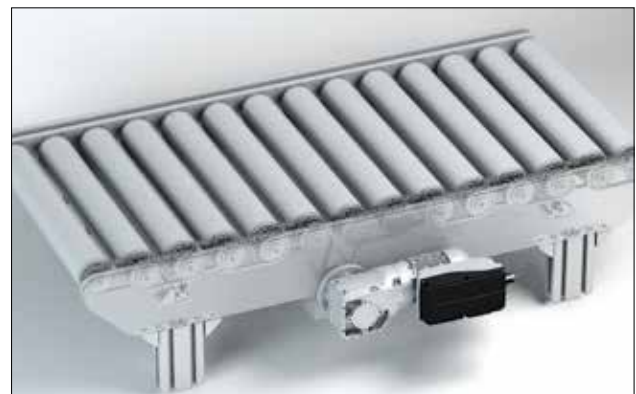
Ejemplo: Roller Conveyor Outline